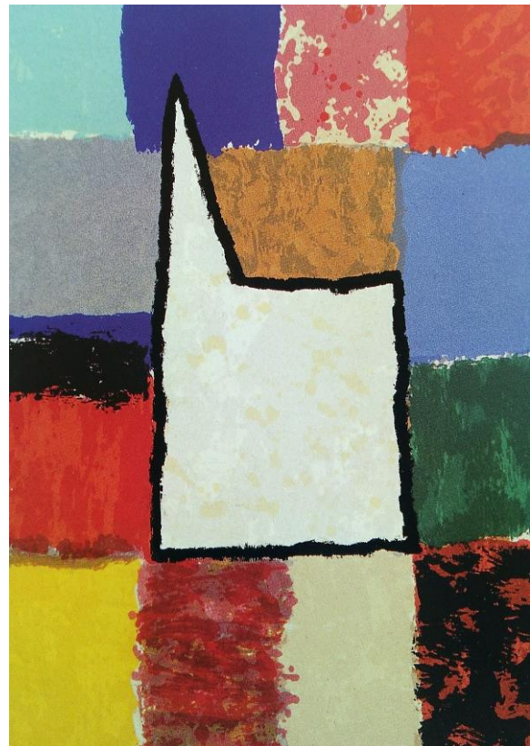
White Chapel, 2000