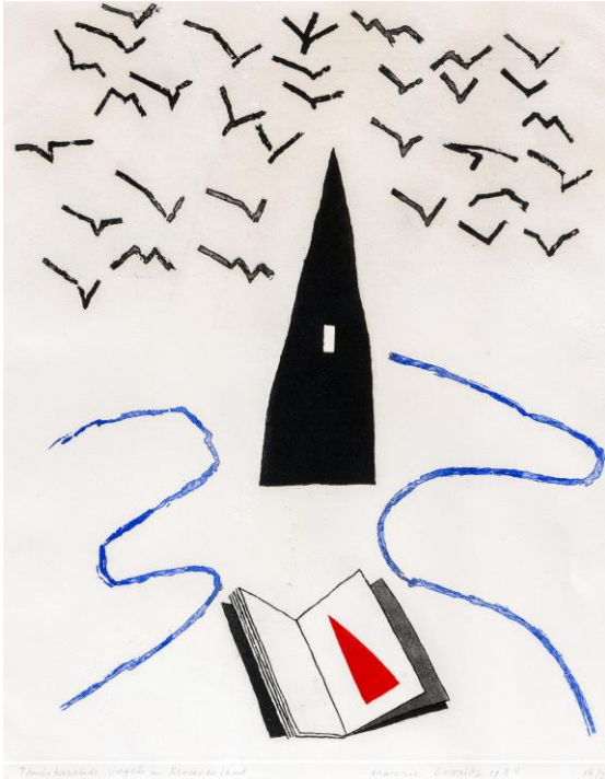
Thuiskerende vogels in Rivierenland, 1988