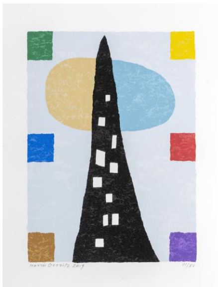
Black Tower of Babel, 2019