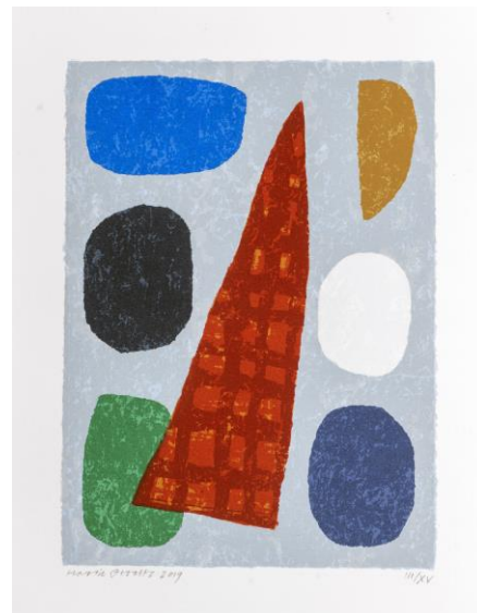
Red Tower of Babel, 2019