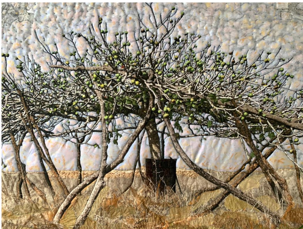
2022, Oude vijgenboom, vrucht dragen